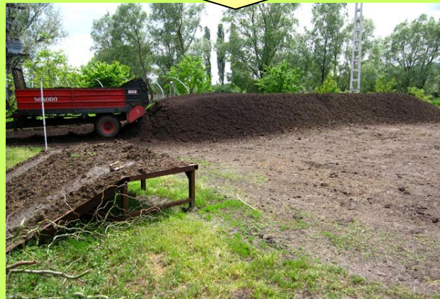
alapanyagok homogenizálása, keverése prizma építése